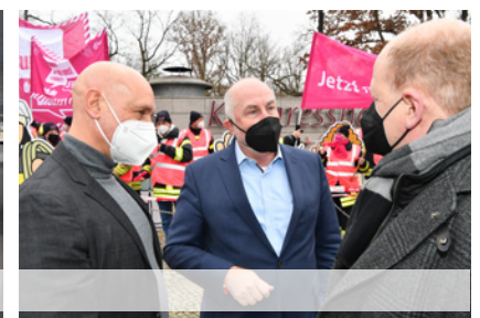
Potsdam, 27. November 2021