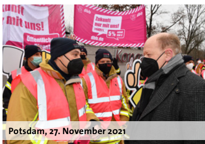
Potsdam, 27. November 2021