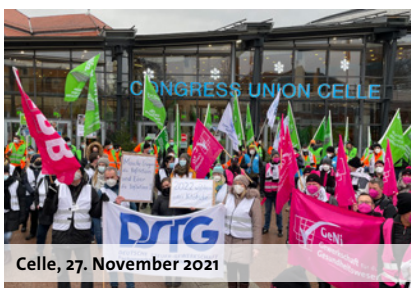
Celle, 27. November 2021