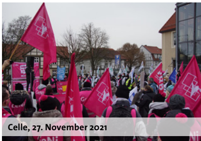
Celle, 27. November 2021