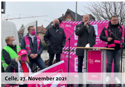
Celle, 27. November 2021